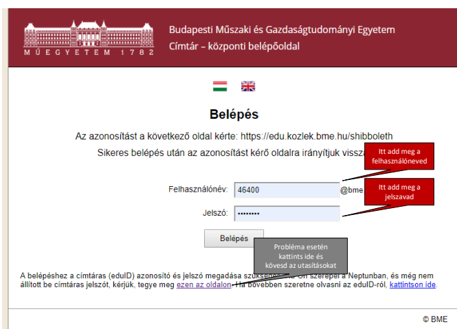
2. ábra: Címtár – központi belépőoldal